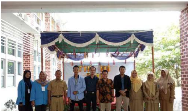
PELAKSANAAN TEMU ILMIAH HUKUM KE III OLEH HIMPUNAN MAHASISWA HUKUM APRIL 2019