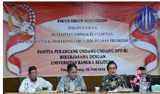
FGD Prolegnas Kerjasama DPD RI dan FH UBB