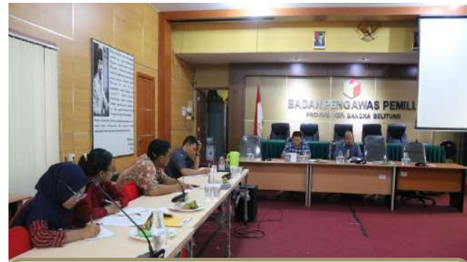
Koordinasi dengan Bawaslu Babel dalam Persiapan Tim Lomba Debat Penegakan Hukum Pemilu