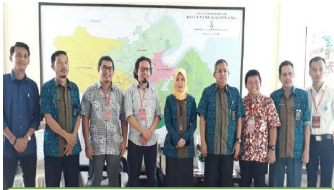
Koordinasi Rekam Sidang TIPIKOR dengan Ketua PN Pangkalpinang dan TIM KPK RI