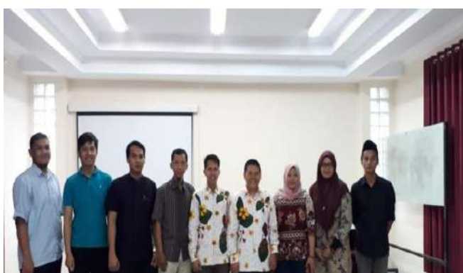
Sosialisasi Penelitian dan Pengabdian Kepada Masyarakat oleh LPPM UBB