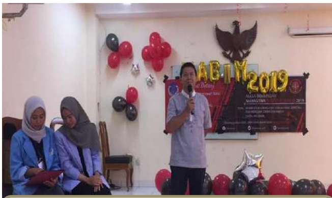
KEGIATAN MABIB FH UBB TAHUN 2019