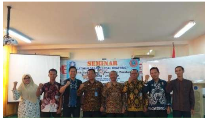
PELATIHAN LEGAL DRAFTING KERJASAMA DPM FH UBB DENGAN KANWIL KEMENKUMHAM BABEL