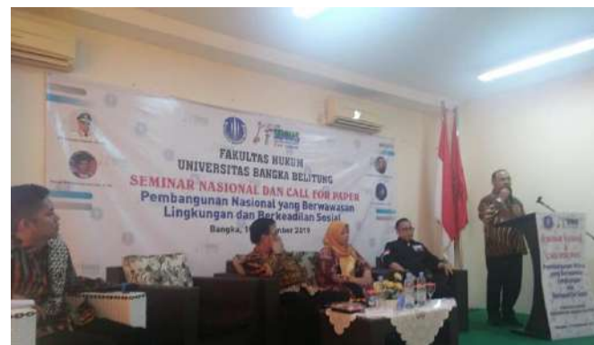
Seminar Nasional dan Call for Paper Bertema Lingkungan dan Pembangunan Berkelanjutan