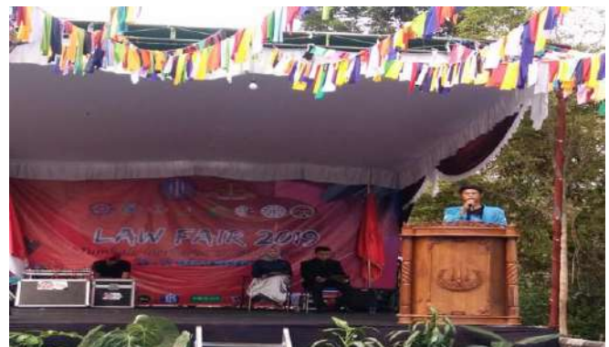
KEGIATAN LAW FAIR OLEH ORMAWA FH UBB