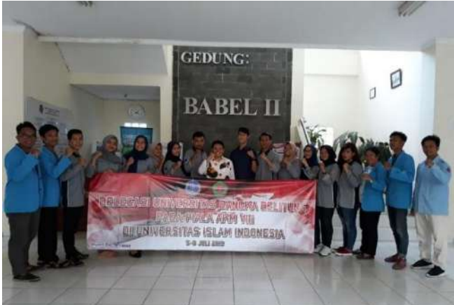
DELEGASI FH UBB DALAM PIALA AKM VIII DI UII YOGYAKARTA JULI 2019