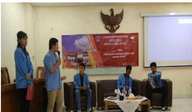
KEGIATAN PELATIHAN KEPEMIMPINAN MAHASISWA OLEH BEM FH UBB